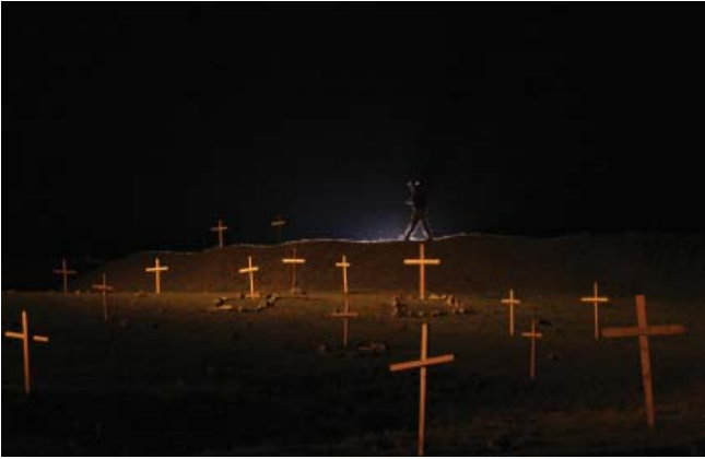
„რენე მიდის პოლივეუდში“